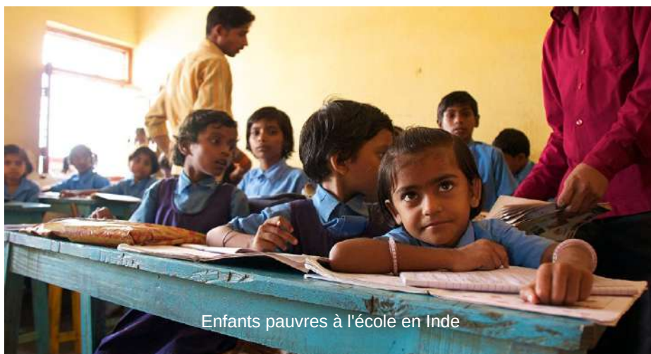
Enfants pauvres à l'école en Inde

N'hésitez plus et montez dans cet avion de l'aventure pour vous lancer dans cette découverte ! J'espère que ce sera avec nous. En tant que présidente, je vous souhaite ce qu'il y a de meilleur et que la Lumière brille dans chacune de vos maisons.