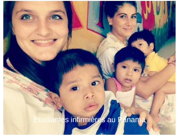
Etudiantes infirmières au Panama