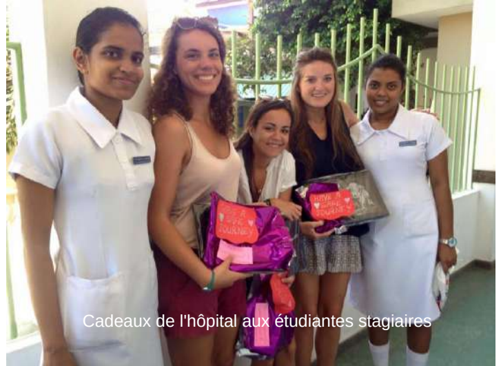
Cadeaux de l'hôpital aux étudiantes stagiaires